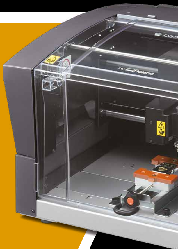
Modèle présenté avec étai centreur en option

Dotée de deux interfaces de connexion, la DE-3 propose une connectivité USB et LAN permettant de piloter plusieurs machines. Renforcez votre production avec la DE-3.